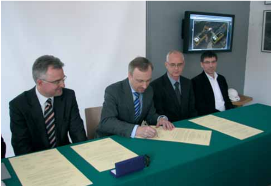
fol. P. Osowicz