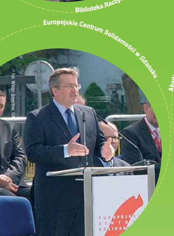
Europejskie Centrum Solidarności w Gdańsku