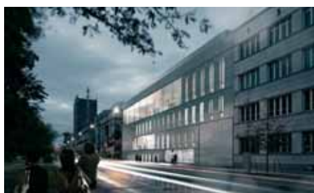
Pracownia Architektury JEMS Architektury Sp. z o.o.

Całkowita wartość projektu realizowanego przez Akademię Sztuk Pięknych w Warszawie wynosi 65,54 mln zł, dofinansowanie z Europejskiego Funduszu Rozwoju Regionalnego: 41,14 mln zł.