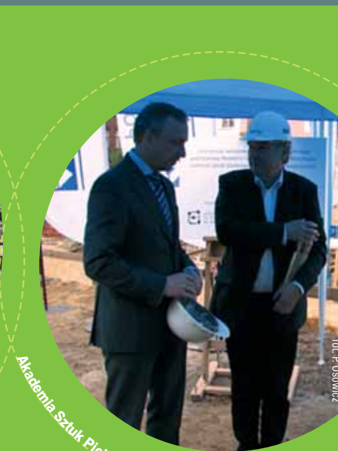
Akademia Sztuk Pięknych we Wrocławiu