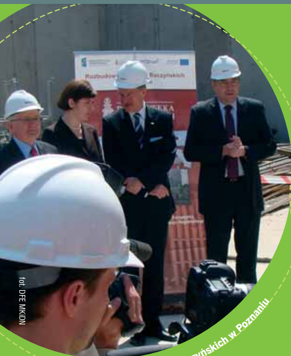
Biblioteka Raczyńskich w Poznaniu