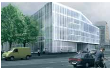
Pracownia Architektury Głowacki, PAG

„Infrastruktura szkolnictwa artystycznego”, Priorytetu XI „Kultura i dziedzictwo kulturowe” Programu Operacyjnego „Infrastruktura i Środowisko”. Projektowi o wartości całkowitej 61,97 mln zł przyznano dofinansowanie ze środków unijnych w wysokości 45,40 mln zł.