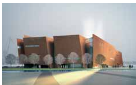
Projekt architektoniczny: Wojciech Targowski

Zakończenie jego realizacji jest planowane na październik 2013 r.